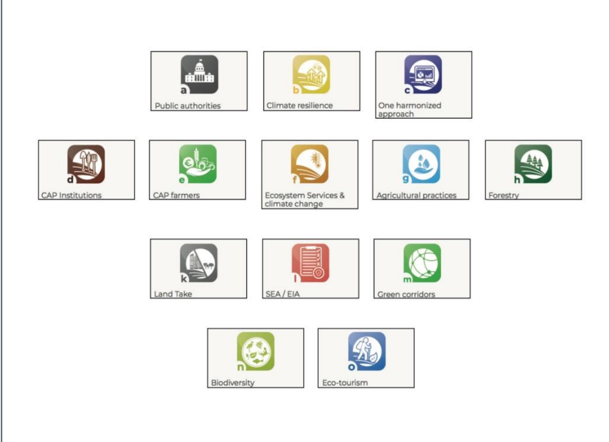
Fig. 2. Suite di tool di LANDSUPPORT